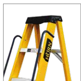
Barandas de seguridad

*Los accesorios de las escaleras se venden por separado y complementan su funcionamiento. Para consultas, contacte a su asesor comercial.