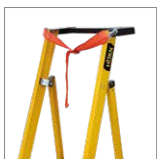
Correa de amarre

*Los accesorios de las escaleras se venden por separado y complementan su funcionamiento. Para consultas, contacte a su asesor comercial.