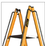
Barandas de seguridad

*Los accesorios de las escaleras se venden por separado y complementan su funcionamiento. Para consultas, contacte a su asesor comercial.