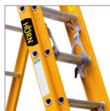
Sistema de bloqueo para peldaños