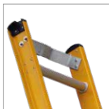
Apoya poste metálico antideslizante