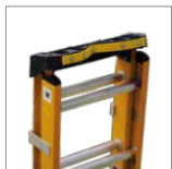
Bandeja dieléctrica V-topTool

*Los accesorios de las escaleras se venden por separado y complementan su funcionamiento. Para consultas, contacte a su asesor comercial.