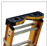
Bandeja dieléctrica V-topTool

*Los accesorios de las escaleras se venden por separado y complementan su funcionamiento. Para consultas, contacte a su asesor comercial.