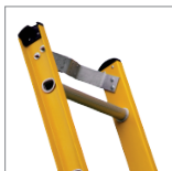
Apoya poste metálico antideslizante