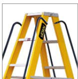
Barandas de seguridad

*Los accesorios de las escaleras se venden por separado y complementan su funcionamiento. Para consultas, contacte a su asesor comercial.